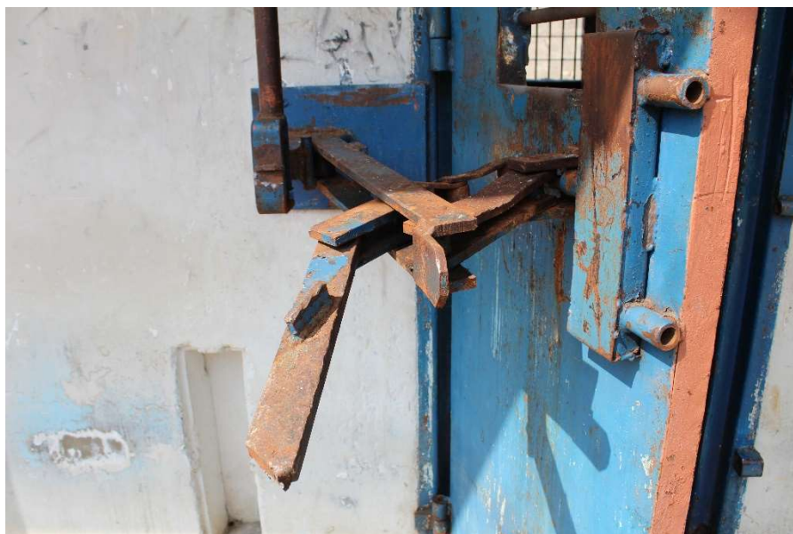
Exemplo de tranca automatizada quebrada

Os presos teriam, então, ateadado fogo na galeria central.