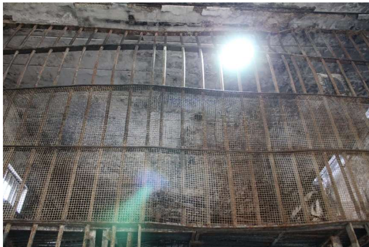
Grades da galeria central danificadas