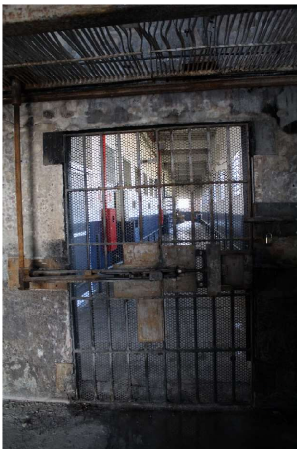
Entrada do pavilhão da cozinha