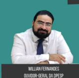
WILLIAN FERNANDES OUVIDOR-GERAL DA DPESP