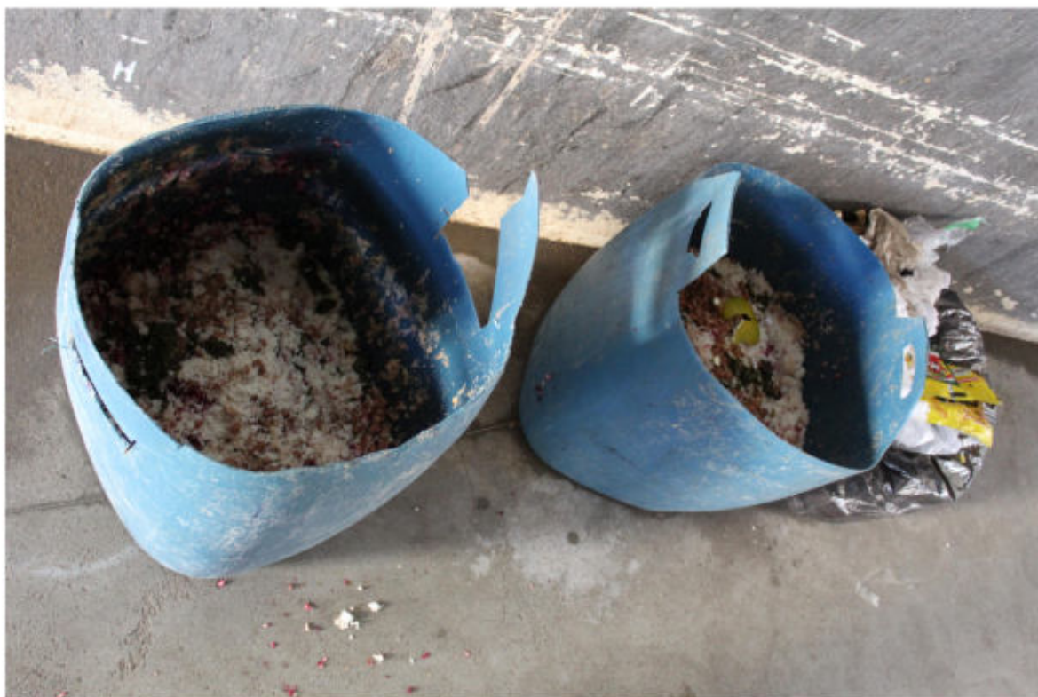
Restos de comida no refeitório

As condições de higiene são muito ruins. Os presos relataram que o local tem baratas, ratos e escorpiões. No refeitório também se observou uma grande quantidade de restos de comida.