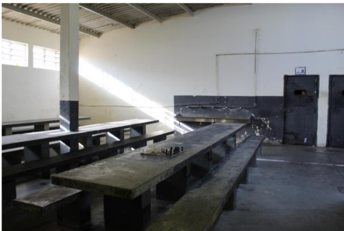
Ala do semiaberto. Observa-se que o portão de acesso tem um pequeno vão, impedindo também a ventilação do local

Chama atenção o pavilhão do semiaberto, que tem péssimas condições de salubridade. No momento da visita, os presos já se encontravam trancados. Foi observado que além de não haver ventilação adequada, o local sequer tem iluminação. Trata-se de um ambiente com mau cheiro, abafado e escuro. A pouca iluminação vem de uma televisão no momento em que está ligada e de poucos refletores existentes na parte externa.