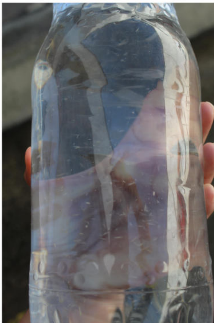
Água armazenada pelos presos para consumo

presos separam a água e esperam ela perder a temperatura para realizar o consumo. Apesar da direção relatar que a água é tratada e própria para o consumo, foi unânime entre os presos que a água seria imprópria. Em um dos recipientes por eles mostrado, constatou-se a presença de sujeiras, havendo, dessa forma, dúvidas a respeito da potabilidade da água fornecida.