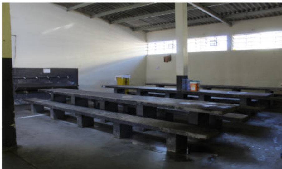
Refeitório do semiaberto