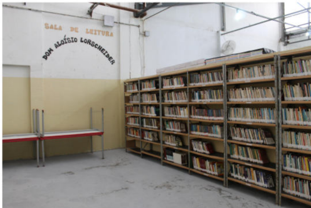
Sala de leitura

O local conta com uma biblioteca com um acervo de 3199 livros e com 03 presos monitores.