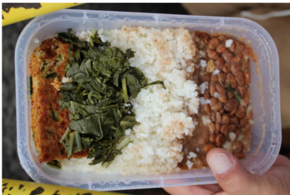
Refeição recebida pelos presos

Atendimento de saúde: o local conta com uma enfermaria, um consultório odontológico e dispensário. Nesse ponto, cumpre fazer um elogio ao estabelecimento prisional, pois toda essa área é extremamente limpa e organizada.