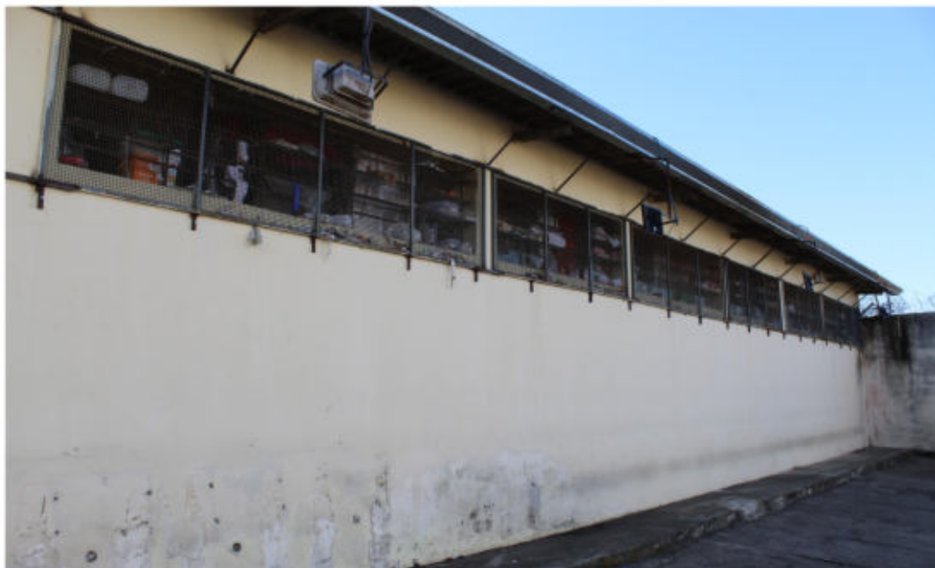
Refletores do lado externo. Única iluminação das celas