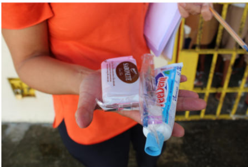
Kit de higiene recebido pelos presos

Com relação ao kit de higiene, os presos informaram que recebem uma pasta de dente, um sabonete e uma lâmina de barbear por mês. Disseram que a cada dois meses também recebem uma escova de dente. Todos os presos informaram que a quantidade de itens recebida é insuficiente para o mês. Anota-se que, na última inspeção realizada pelo NESC, foi relatado que os presos recebiam quase o dobro do material recebido atualmente, com 02 sabonetes, duas lâminas de barbear e uma pasta de dente.