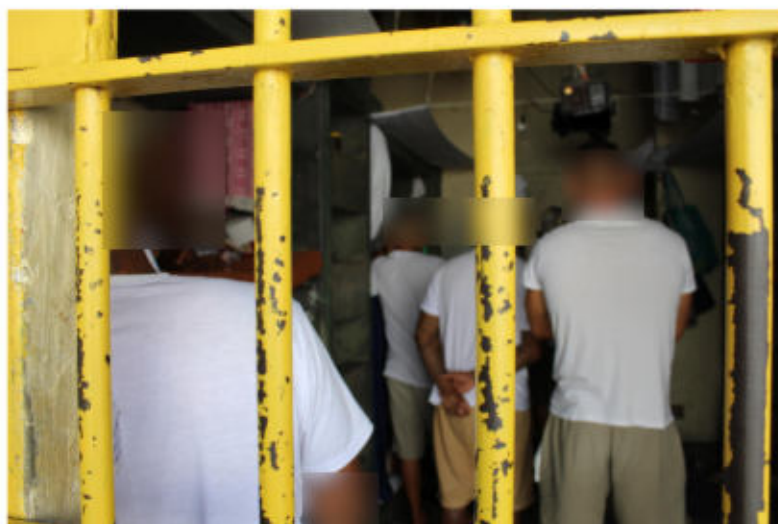
Cela do setor de convívio

Da mesma forma que em todas unidades padrões da SAP, as celas não possuem janela e não têm ventilação adequada.