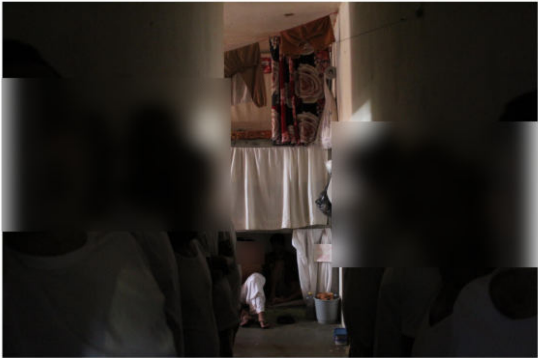
Ala do semiaberto