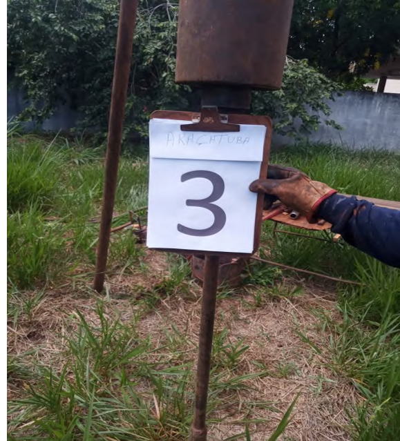
Figura 3: Execução do furo de sondagem SP-03