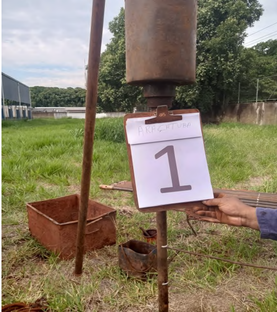
Figura 1: Execução do furo de sondagem SP-01